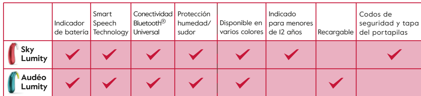
Tabla comparativa. Sky - Audéo